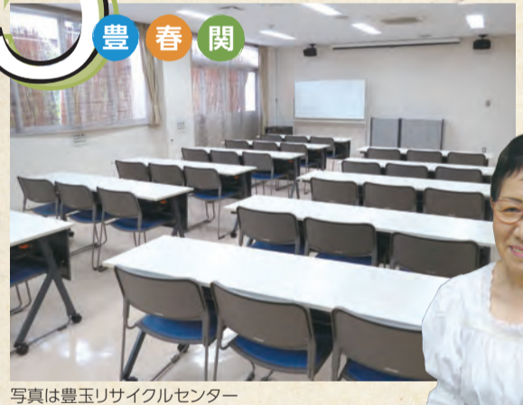
写真は豊玉リサイクルセンター

リサイクル活動を目的とする団体、地域住民の相互交流および自主的活動を目的とする団体で、構成員の条件を満たせば利用登録ができます。登録団体は、冊子やチラシを安価に印刷できる印刷機も使用できます。 *利用料は、部屋のタイプや時間帯によって異なります。詳細は、団体登録を希望するリサイクルセンターに直接お問い合わせください。