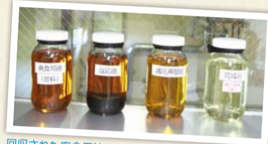
回収された廃食用油は化学処理を施してバイオ燃料へ

100ℓのバイオ燃料を精製するには、135ℓの使用済み食用油が必要です。より多くの方に油のリサイクルに参加していただくことで、さらなる環境負荷の軽減につなげることができます。