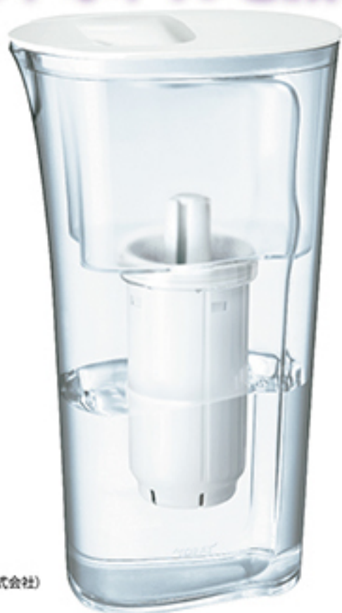
ポット型浄水器