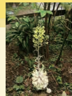
4月になると黄色い花が咲きます

たとえば、講座ルポでご紹介した葉ポタンのこけ玉。お正月が過ぎたら、水苔を外し、地植えや植木鉢に植え替えてください。春先に菜の花に似た花が咲きます。芯になる植物が元気ならば、こんな楽しみ方もオススメです。命ある植物を大切に育てる、それもリサイクルセンターの講座ならではの魅力です。