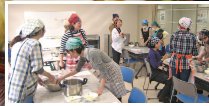
●豊玉リサイクルセンター● 国産の大豆、米麴、麦麴で無添加のお味噌作り