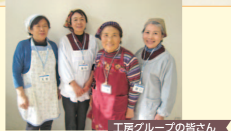
工房グループの皆さん

講師は工房グループのボランティアの皆さんです。講座はまずフードマイレージ、地産地消についてのお話から。国産大豆の生産量や大豆の花を当てるクイズなど、楽しみながら国産の食品を選ぶ意味を理解しました。その後、味噌作りの実習へ。この日を楽しみにしていた参加者の皆さんはやる気満々。チームワーク良く、味噌作りが始まりました。