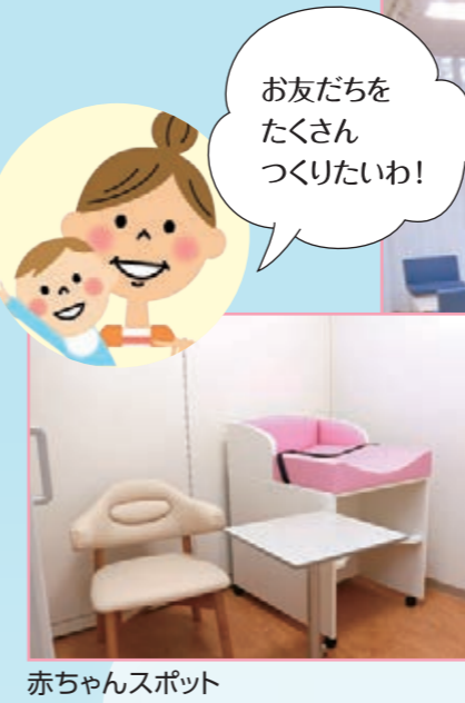
赤ちゃんスポット

正面入口の左側に広がるコミュニティコーナーは、利用者の皆さまの交流の場として自由に使用いただけるスペースです。授乳やおむつ替えにご利用いただける「赤ちゃんスポット」、洗面コーナーも設けました。